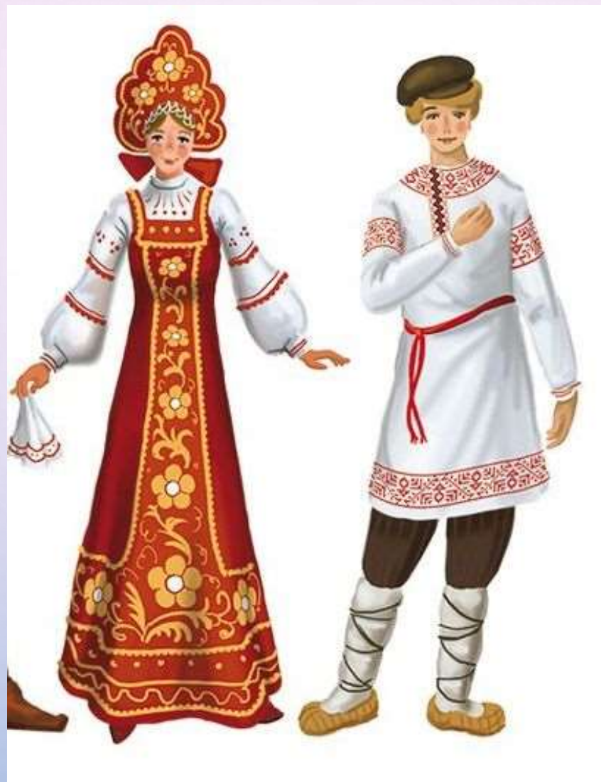
Русский народный костюм