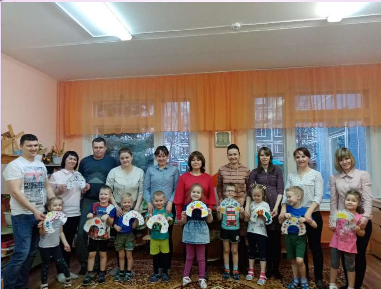
Совместные работы детей с родителями