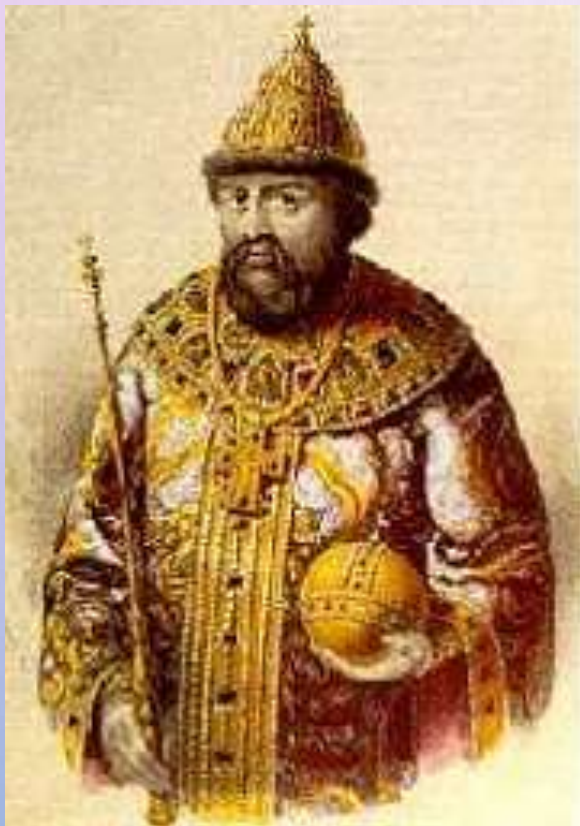
Царь Алексей Михайлович