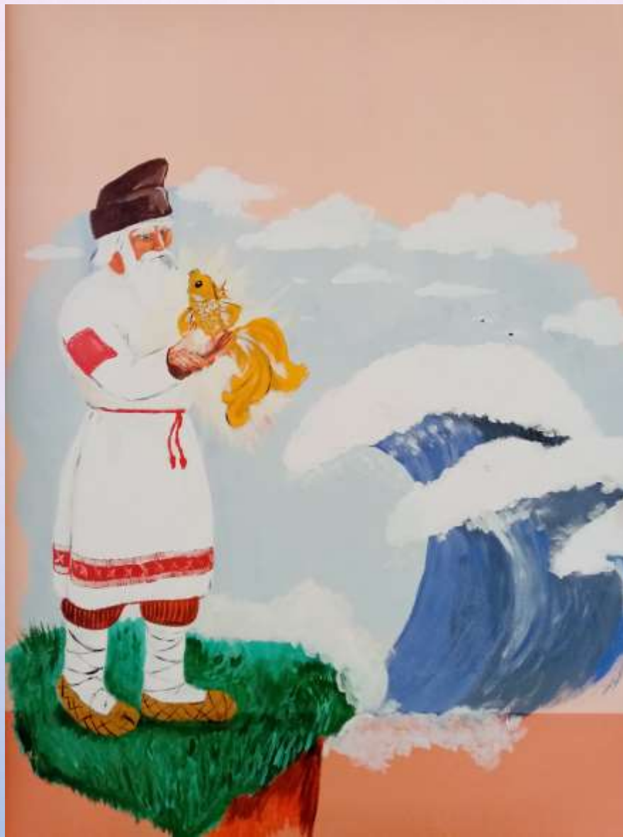
Иллюстрация старика в русском костюме на стене в группе из сказки А.С. Пушкина «О рыбаке и рыбке».