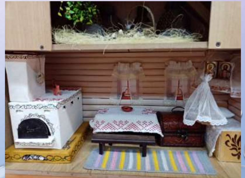
Макет «Русская изба» (Создан совместно с родителями воспитанников).